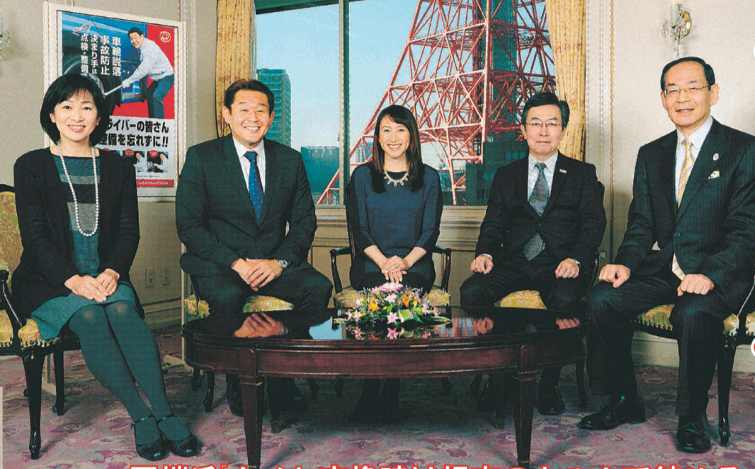
田端氏「タイヤ交換時は規定のトルクで締める」